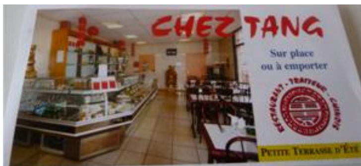
Traiteur - Restaurant - 3 bis Allée du Bourbonnais - 78310 MAUREPAS